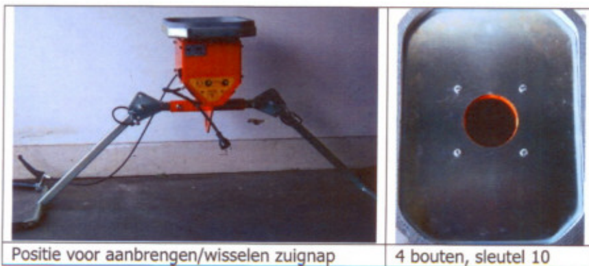
Positie voor aanbrengen/wisselen zuignap

Afhankelijk van het gewicht van het op te pakken product kiest u een geschikte zuignap. Bevestig deze onder het vacuümunit d.m.v. de 4 bouten (vast is vast). Wees er zeker van dat de zuignap goed vlak gemonteerd zit.